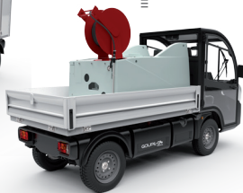
Bewässerung / Hochdruckreiniger